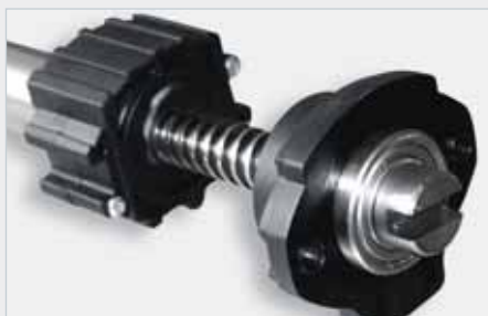
Detail masivní ocelové šroubovice uložené v kuličkových ložiscích.

Pohonná jednotka tousek Slim má elektromechanický převod a skládá se z nerezové pístnice s integrovanou samobrzdicí šroubovicí. Ta je poháněna výkonným 12-ti voltovým motorem na stejnosměrný proud.