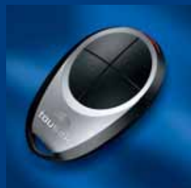
program dálkového ovládání tousek kompatibilní a bezpečný