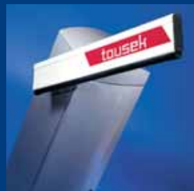
závorové systémy tousek robustní a tvarově dokonalé