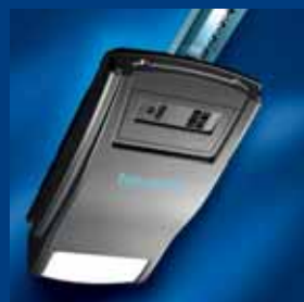
pohony garážových vrat tousek úsporné a rychlé