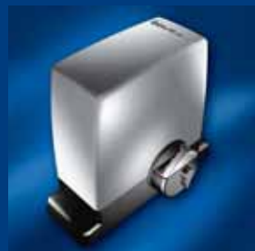
pohony posuvných bran tousek kompaktní a stabilní