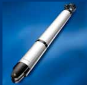
pohony křídlových bran tousek silné a hospodárné