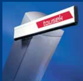
závorové systémy tousek robustní a tvarově dokonalé