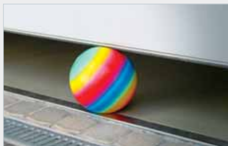
Všechny pohony TT-Série jsou vybaveny automatickým revers systémem ARS

Vrata s vertikálním vedením potřebují dodatečně speciální zakřivené rameno tousek ⑦, dvoukřídlá ven se otevírající vrata (až do max. 1,4m šířky křídla), potřebují adaptér ⑧, aby byl zajištěn správný chod. Pro lehké a středně těžké vrata doporučujeme obzvláště rychlý pohon tousek TT60. Výkonnějším motorem vybavený tousek TT120, byl vyvinut pro těžká vrata.